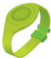
リストバンド (モジュールはバンド部に搭載)