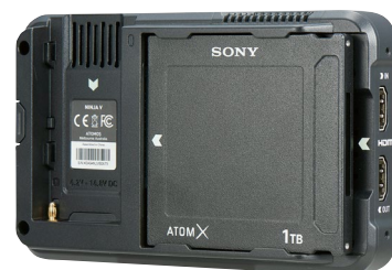
▲ ATOMOS社NINJA Vでの使用イメージ

*1 ATOMOS社SUMO19/19M, SHOGUN STUDIOに使用する場合は、AtomX SSDminiハンドル(ATOMXSSDH1)が必要です。