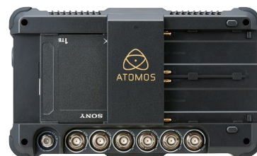
▲ ATOMOS社SHOGUNでの使用イメージ