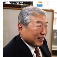
盛岡 Value City 株式会社 取締役副社長

MORIO-J カードは、2015年3月から加盟店99店舗、端末台数125台でサービスインしま