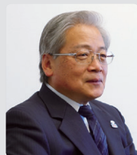
イオンリテール株式会社 電子マネー推進本部 本部長