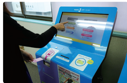
JOY カード利用者がスムーズに MORIO-J カードへ移行できるように開発された端末

商店街は、40年以上前から「JOY」というポイントカードを発行しており、その数は約30万枚に及びます。しかし、磁気タイプであったために汎用性が低く、なおかつ端末自体も老朽化が進んでいたことから、新たな仕組みを検討。さまざまな方法を検討した中で、着目したのがご当地 WAON でした。ご当地 WAON は、地域経済活