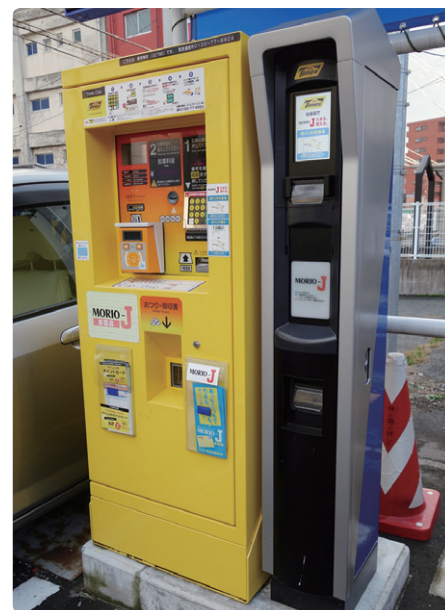
盛岡市内の対象タイムズ駐車場と連携し、パーキング専用の読み取り装置を設置。タイムズポイントと MORIO-J ポイントを同時にためることができるようになった

商工会、市、商店街などを巻き込んで実現した MORIO-J カードは、今や商店街を訪れる人にとってなくてはならない存在となりました。盛岡 Value City では、サービスインから 5 年間で MORIO-J カードの発行数 30 万枚、加盟店数 300 を目標に掲げて事業を推進しています。「さらなる利便性向上に向けて、MORIO-J カードを病院や市役所などでも利用できるようにするこ