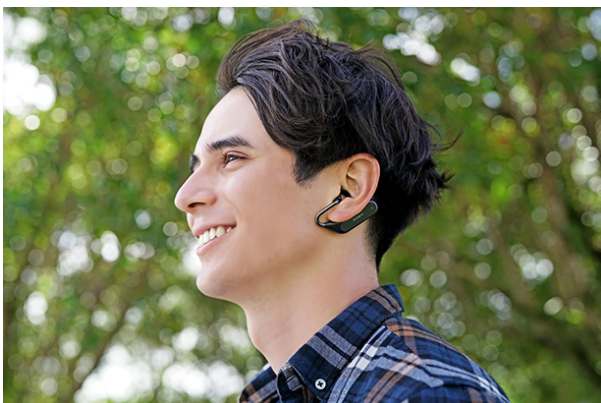
Xperia Ear Duo 使用イメージ