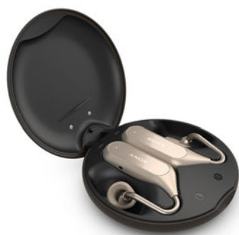
Xperia Ear Duoと充電ケース

NFMI（Near-Field Magnetic Induction/近距離電磁誘導）を採用し、アンテナ設計を最適化したことで、低遅延と安定した接続性の左右独立型のケーブルレススタイルを実現しています。