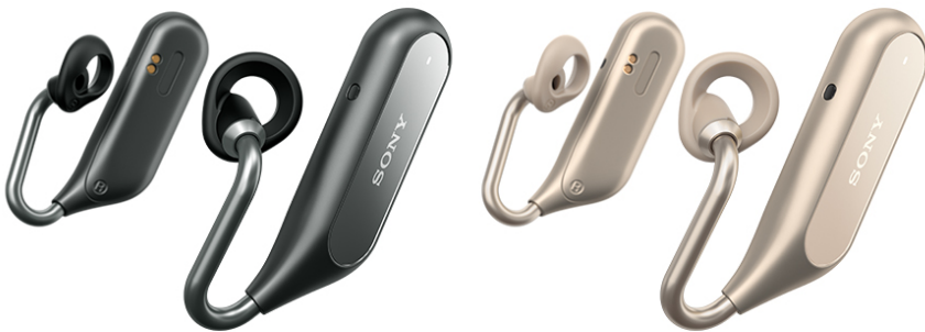
Xperia Ear Duo（ブラック、ゴールド）

ソニーモバイルは、よりパーソナライズされ、より高い知能と機能を備えた、新たなコミュニケーションを提案するXperiaスマートプロダクトを展開しています。